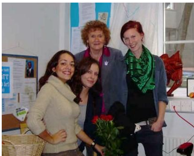
Personalen på kansliet